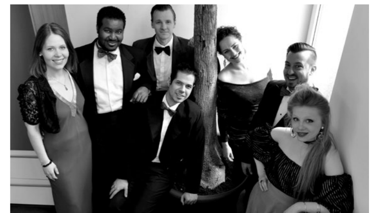
Opera et Cetera

Tauchen Sie mit Opera et Cetera ein in die Welt des Films. Das Ensemble präsentiert Ihnen Highlights aus deutschen und internationalen Klassikern. Genießen Sie Filmmusiken der letzten Jahrzehnte und freuen Sie sich auf einen bunten Streifzug durch die Zeit und kreuz und quer durch die Welt.