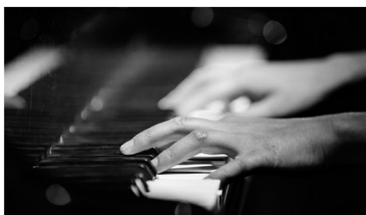
Schüler:innen und Preisträger:innen

1.5. Konzert Schüler:innenkonzert des Frankfurter Tonkünstlerbunds