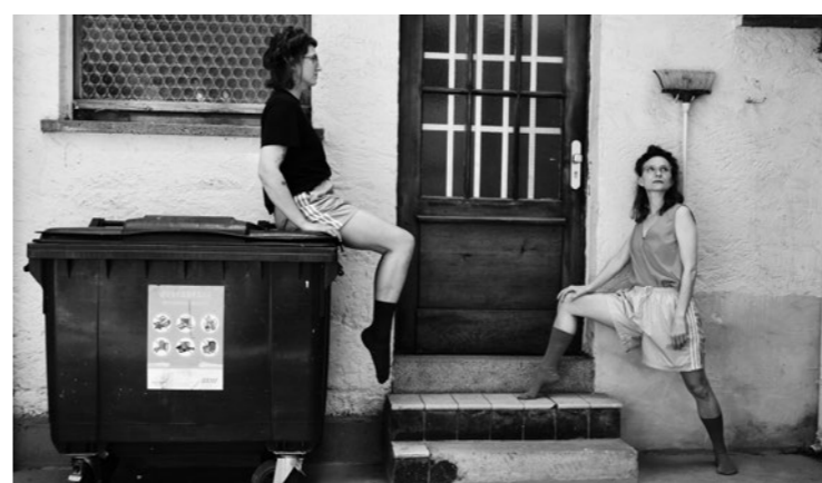
PINK & BLAU

9.5. Tanz und Performance Boom! *hap(ə)niNG